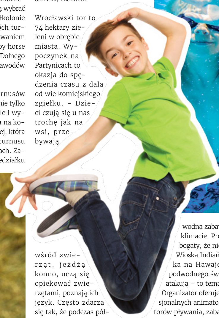
WROCLAWSKI TOR WYSCIGOW KONNYCH PARTYNICE