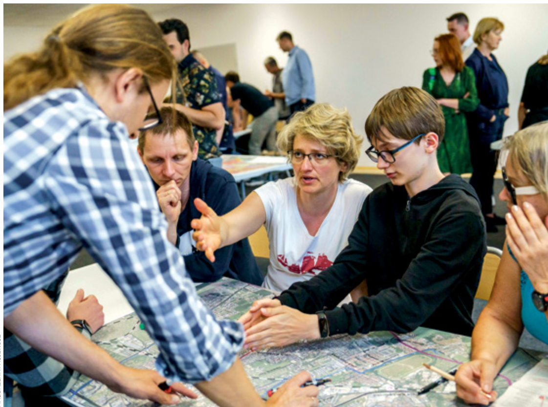
Na pierwszych dwóch spotkaniach było sporo osób, przed nami kolejne trzy – warto wyrazić swoją opinię

– Ja powiem szczerze, najbardziej wnioskuję o to, żeby podnieść linię kolejową 285 na estakadę albo schować do wykopu w obrębie Wrocławia, czyli żeby było skrzyżowanie bezkolizyjne na Zwycięskiej, Grota-Roweckiego