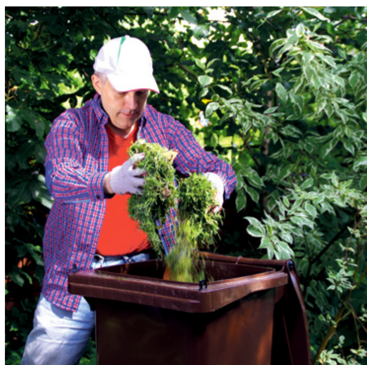
Do brązowego pojemnika wrzucamy resztki jedzenia i odpady z ogrodu

Właśnie zaczął się okres częstszych odbiorów „zielonych odpadów”. Zarządcy mogą także zamawiać kontenery na odpady pochodzące z pielęgnacji terenów zielonych.