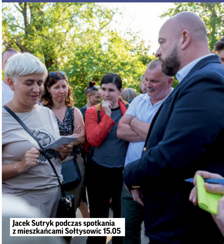
Jacek Sutryk podczas spotkania z mieszkańcami Sołtysowic 15.05