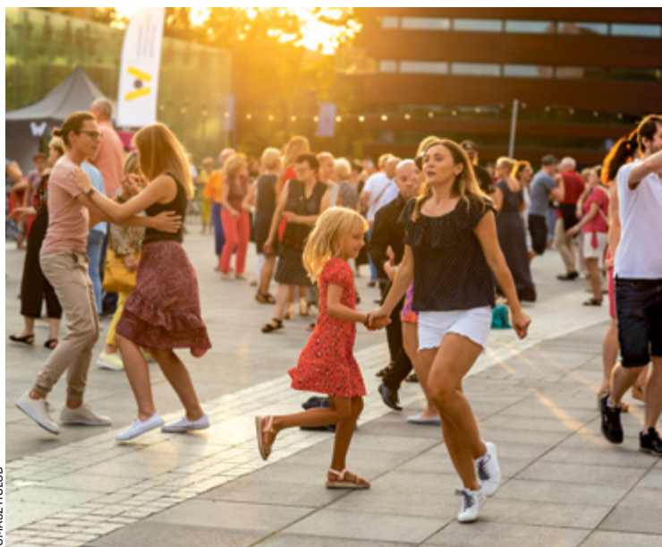
Potańcówki na pl. Wolności zaczną się 22.06, a skończą 7 września br.

Przed nami kolejne lato z Wrocławskimi Potańcówkami pod chmurką. My podajemy terminy, ty zanotuj je w kalendarzu.