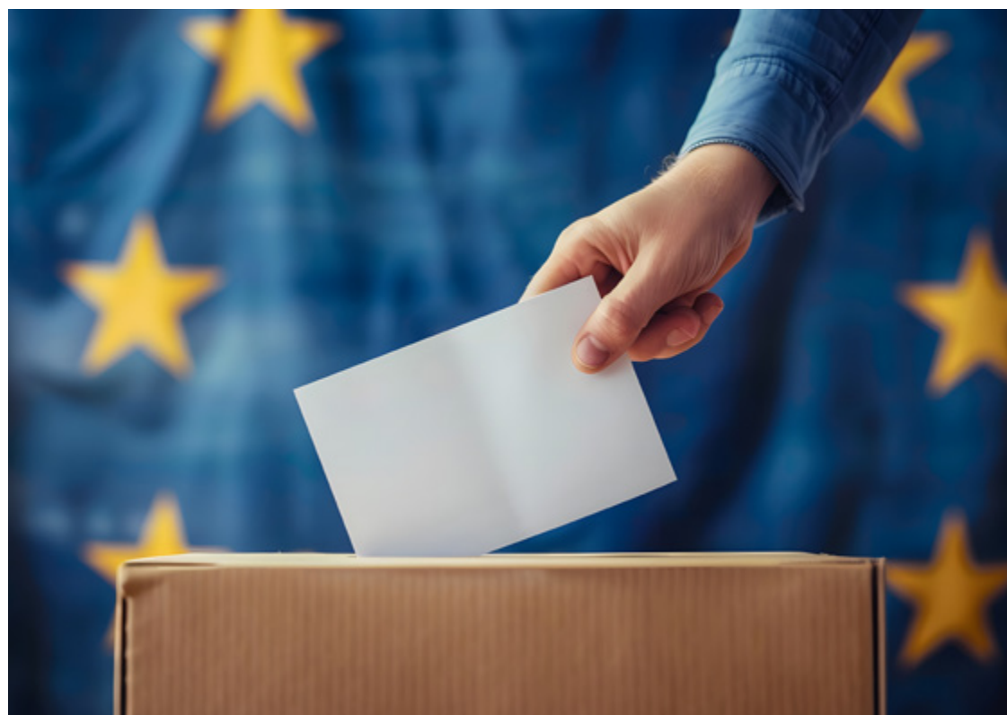
Wybory do Parlamentu Europejskiego odbędą się 9 czerwca 2024 roku. Oddać głos można w godz. 7-21

Przypomnijmy, że w Parlamencie Europejskim zatwierdzane są akty prawne, które obowiązują we wszystkich krajach Unii Europejskiej. Dotyczą one gospodarki, opłat celnych i dotacji, ale również spraw społecznych, rynku pracy, prawa finansowego. Aż 70 procent przepisów obowiązujących w Polsce przeszło wcześniej właśnie przez Parlament Europejski.