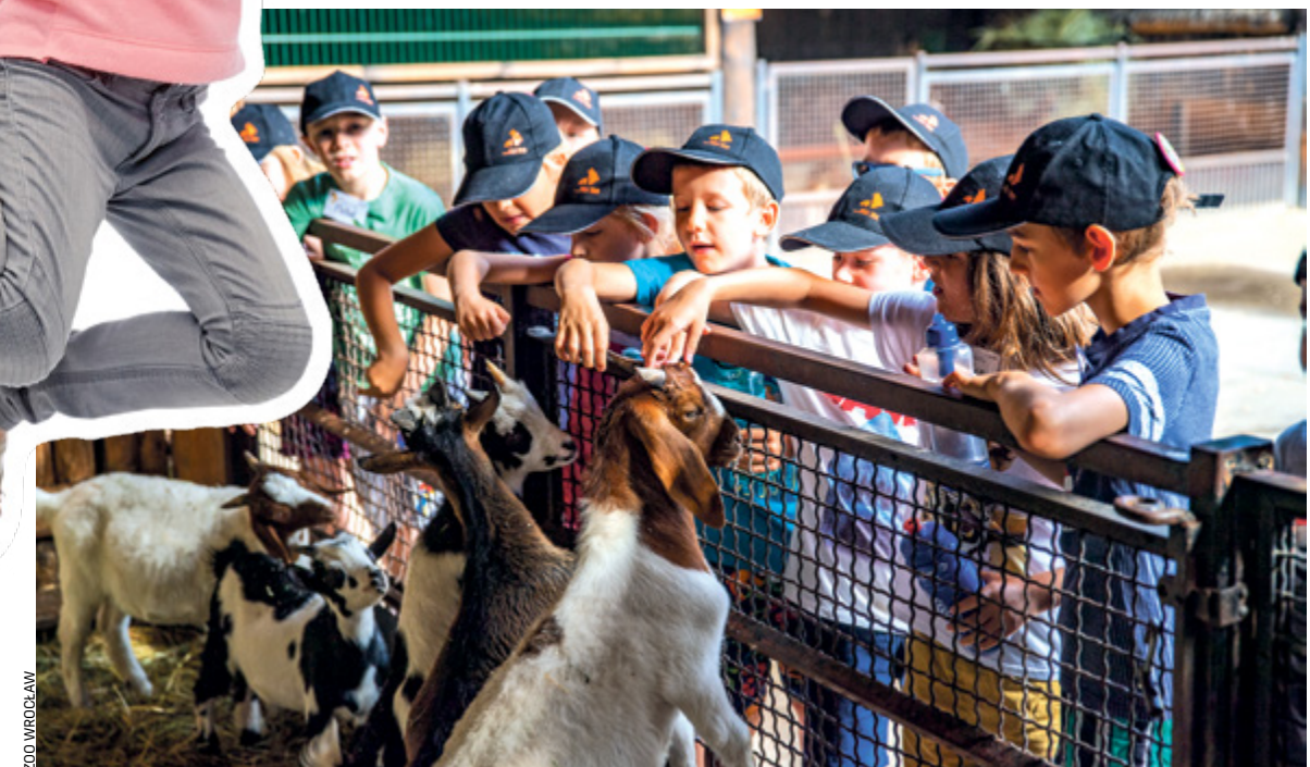
Wrocławski Ogród Zoologiczny wyprzedził już miejsca na półkoloniach, warto więc sprawdzić inne oferty