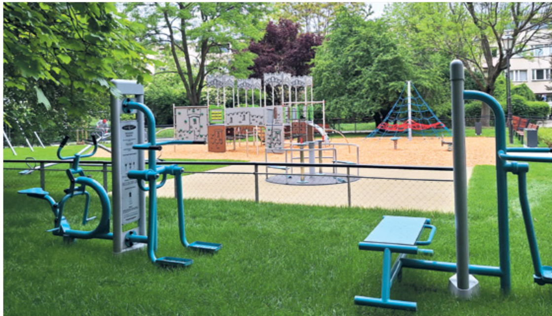
Zielony dywan z trawy i kolorowe urządzenia dla młodszych, a siłownia – dla starszych mieszkańców

Pojawiła się siłownia plenerowa i nowe ławki (w tym jedna ze specjalną osłoną, umożliwiającą dyskretne nakarmienie małego