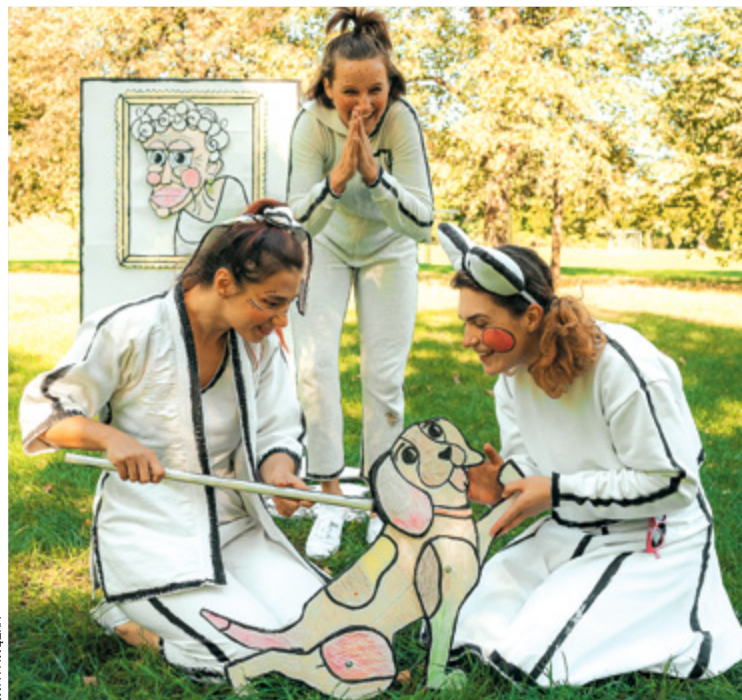
Zola, Lola i Cola to bohaterki spektaklu, który rozpocznie świętowanie

Idealny plan na spędzenie święta mamy i dziecka nie istnieje? Jak to nie! Centrum Kultury Nowy Pafawag zaprasza na swój dziedzińiec. Już w niedzielę 26 maja o godz. 16 zacznie się dzień twórczych spotkań i aktywności na świeżym powietrzu dla całej rodziny.