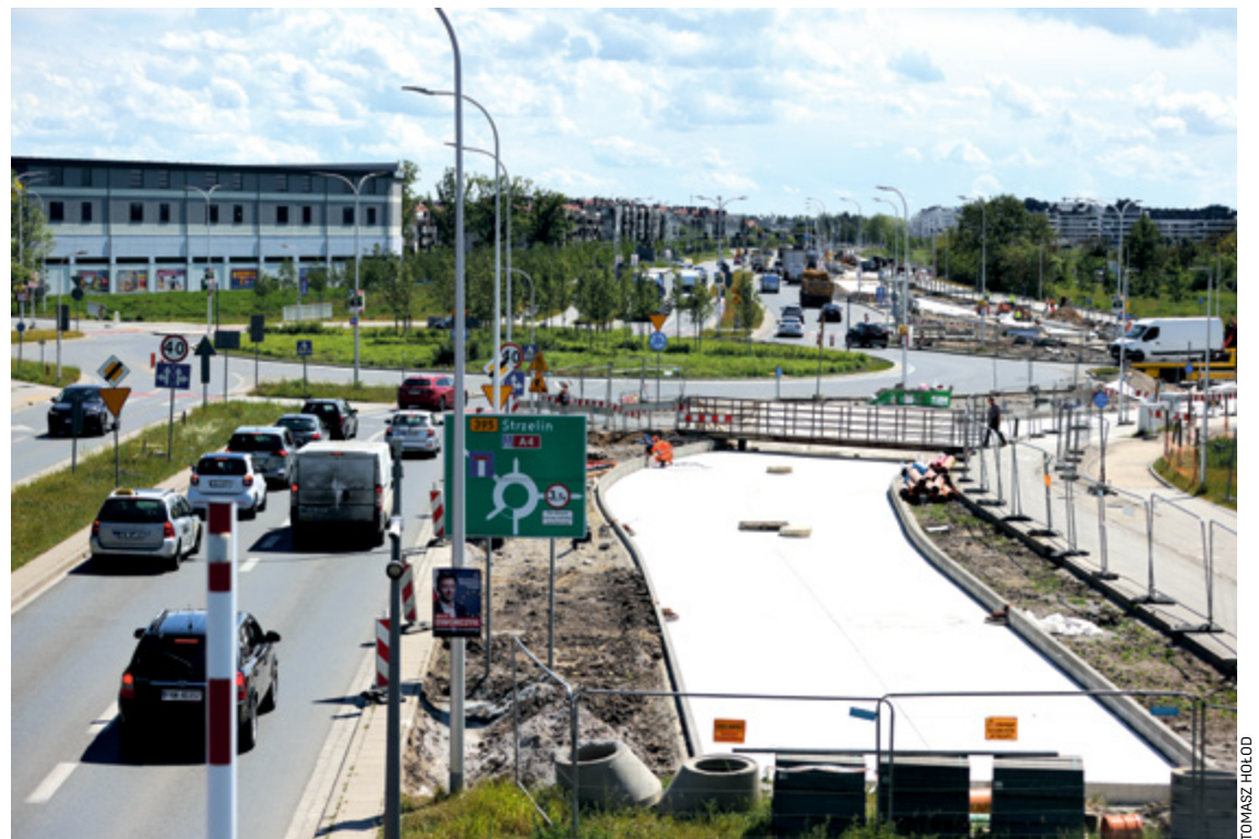
Uwaga kierowcy! Z ronda Wolnej Ukrainy w sobotę 25 maja już nie skręcimy w prawo, w ulicę Terenową

Prace potrwać do dwóch miesięcy. Trasa budowana jest w technologii, która pozwoli na ułożenie na niej torowiska, gdy stanie się to możliwe. Są procesy technologiczne, których skrócić się nie da – wyjaśnia Krzysztof Świercz z Wrocławskich Inwestycji.