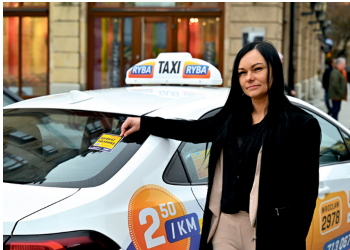
Dzięki miejskiej kampanii „Legalna taksówka” można sprawdzić, czy pojazd jest zweryfikowany przez urząd

Natomiast aż 855 przedsiębiorców nie poddało się weryfikacji i ich licencje stracą ważność 1 lipca 2024 roku, co w praktyce może oznaczać około 2 tysięcy kierowców (przedsiębiorca posiadający licencję może zatrudniać od jednego do kilkuset kierowców, w zależności od liczby posiadanych przez niego taksówek). To szacunki, bo być może w tej liczbie są licencje przewoźników, którzy nie są już czynni