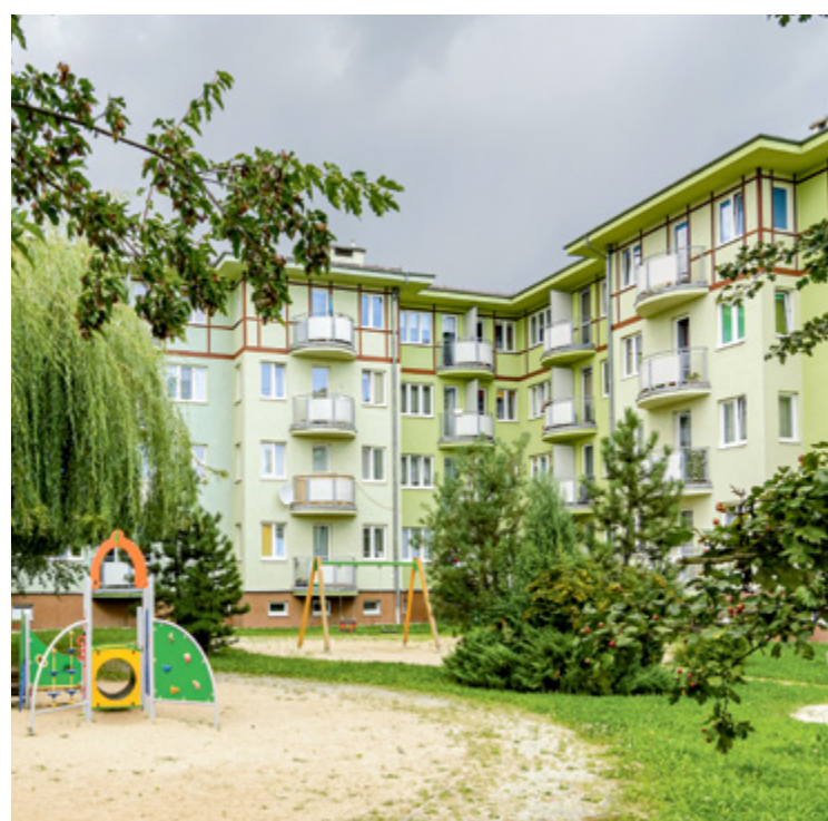
Jedno z osiedli TBS we Wrocławiu mieści się przy ul. Brzezińskiej

W Ogólnopolskim Rankingu Towarzystw Budownictwa Społecznego za 2024 rok zwyciężyło TBS Wrocław. Tak zdecydowali eksperci ze Strefy Gospodarki Biznes Magazynu. To już szósty rok z rzędu, kiedy wrocławski TBS znajduje się na podium.