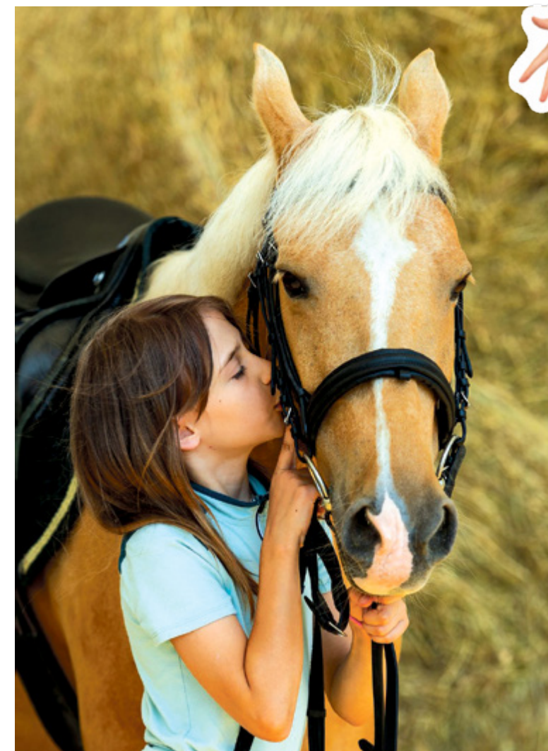
Wrocławski Tor Wścigów Konnych zaprasza na półkolonie w siodle